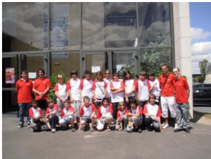
11 ème Edition- Accompagnement OPEN D'AVOINE 2012