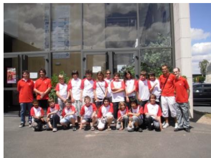
11 e Edition- Accompagnement OPEN D'AVOINE 2012