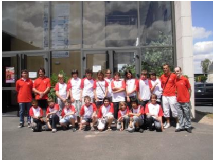
11 ème Edition- Accompagnement OPEN D'AVOINE 2012