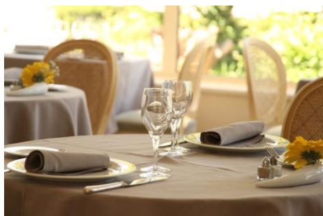
Le restaurant de l'hôtel