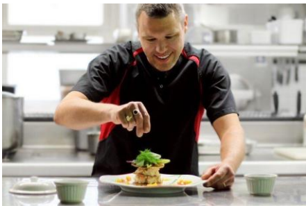
Le chef du restaurant de l'hôtel