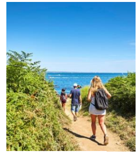
Balades à Fouesnant... en kayaks, à vélos ou à pieds...