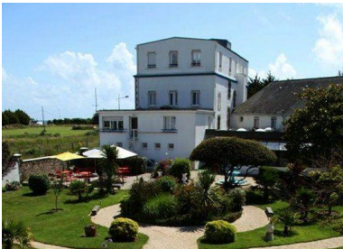
Hôtel de la pointe*** à 100 m de la mer !