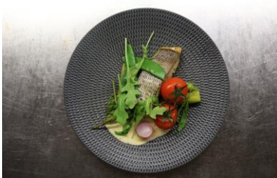
Un des plats gastronomiques du restaurant...