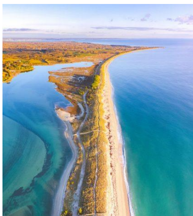
Tout au bout de cette plage... La pointe de Moustierlin !