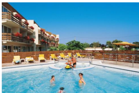
La piscine de l'hôtel !