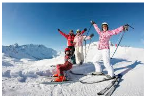
Le ski, c'est le top !