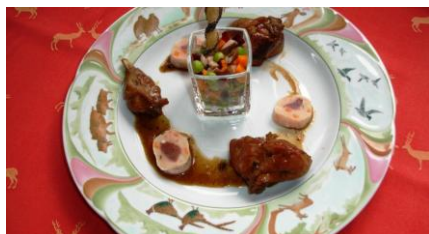
Un plat concocté par le Maître Restaurateur Dominique Briquet