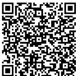
QR Code pour s'inscrire !