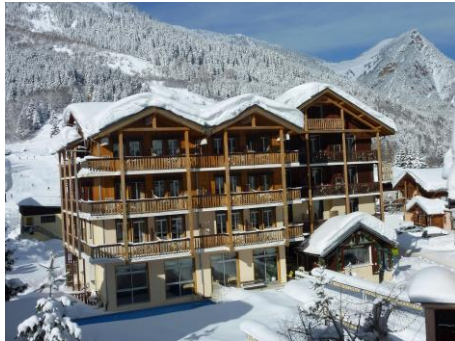
Hôtel du Grand Bec en hiver...